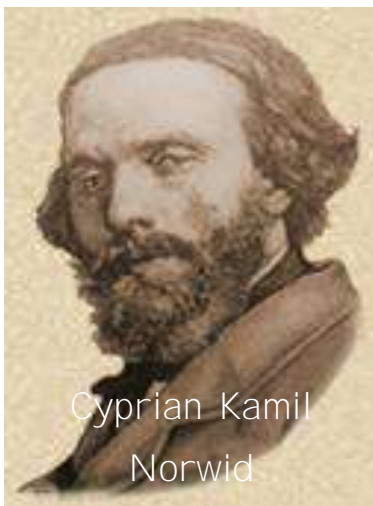
Cyprian Kamil Norwid